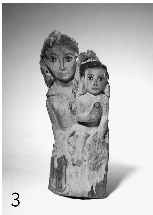
Bild 1: Haus Bahnhofstrasse 10 mit dem Wandgemälde (40er Jahre) (Foto: Kantonsbibliothek Nidwalden) Bild 2: Annemarie von Matt-Gunz 1940 beim Malen des Wandbildes in Root (Foto: Kantonsbibliothek Nidwalden) Bild 3: Ein Werk von Annemarie von Matt-Gunz: Königin von Saba mit ihrem Sohn Menilek, 1942 (Foto: Nidwaldner Museum)