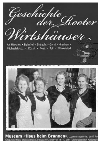
Flyer der verschiedenen Ausstellungen