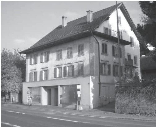
Bild 1 «Schneiderlilnzi» ehemaliges Haus an der Luzernerstrasse 3